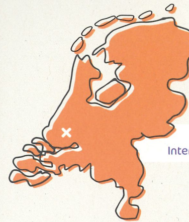
Claypot Church International in Rotterdam